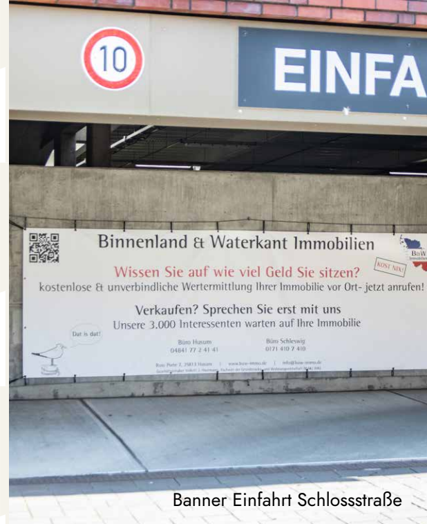
Banner Einfahrt Schloßstraße

zzgl. Produktionskosten in Höhe von 200€