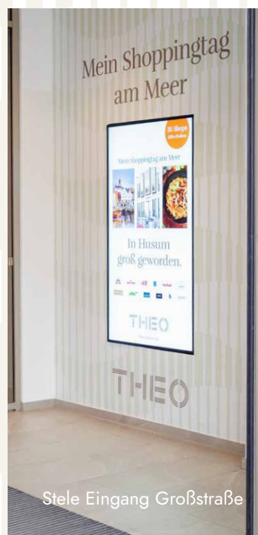
Stele Eingang Großstraße