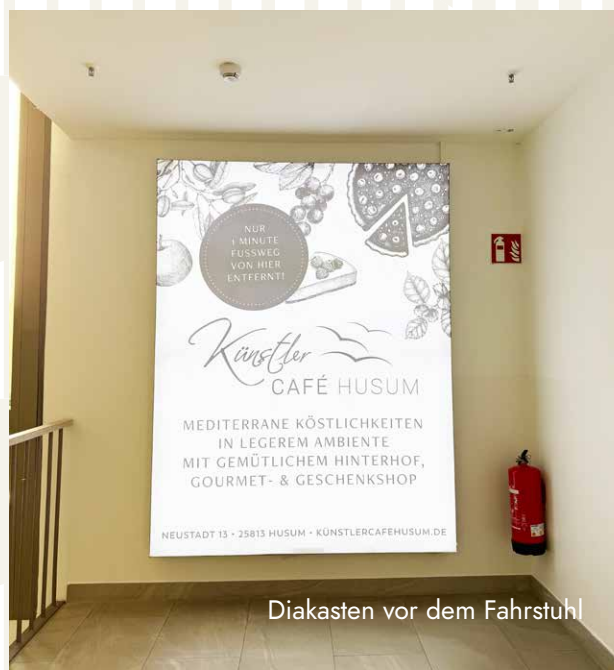
Diakasten vor dem Fahrstuhl