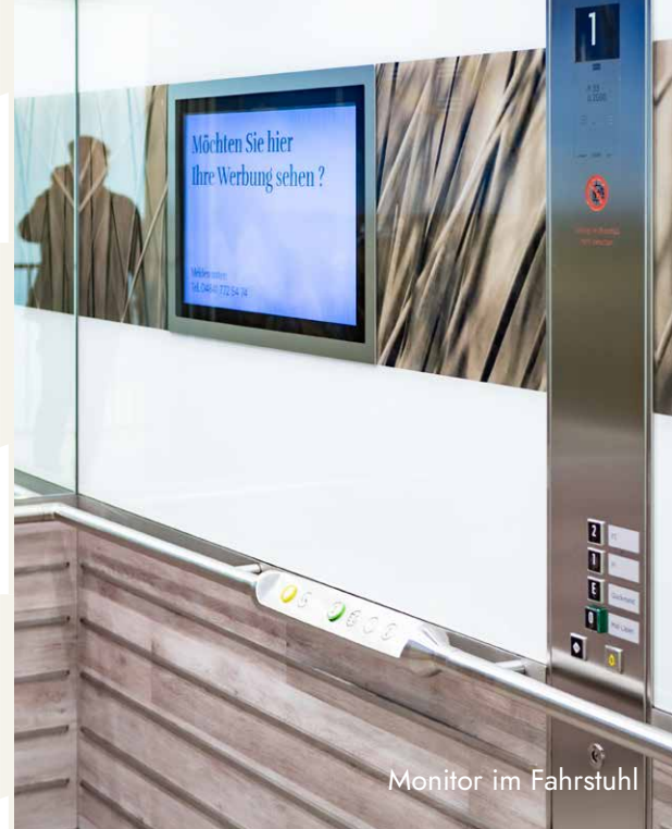
Monitor im Fahrstuhl