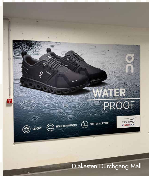
Diakasten Durchgang Mall

zzgl. Produktionskosten in Höhe von 250 €