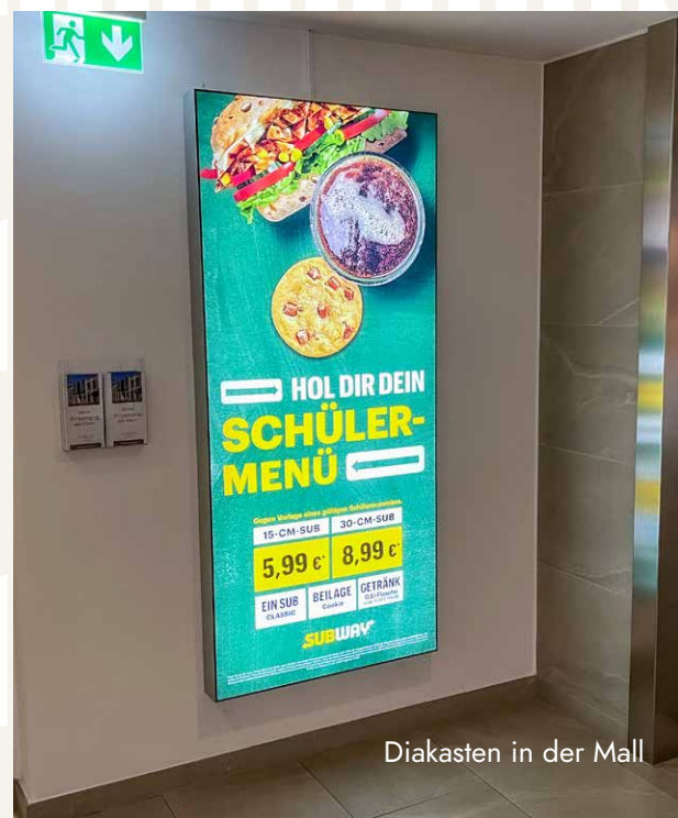
Diakasten in der Mall

zzgl. Produktionskosten in Höhe von 100 €