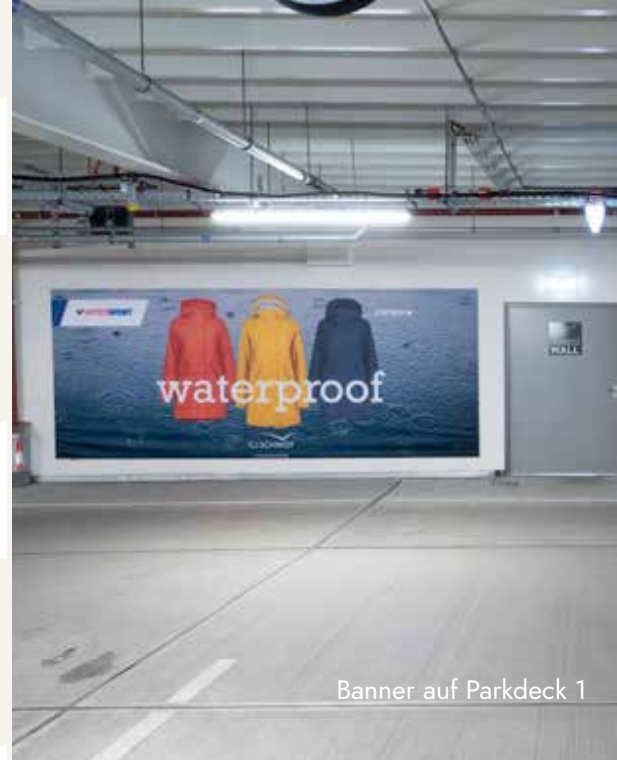
Banner auf Parkdeck 1

zzgl. Produktionskosten in Höhe von 350 €