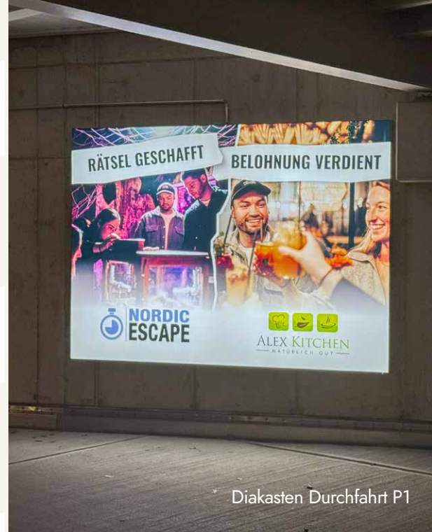
Diakasten Durchfahrt P1

zzgl. Produktionskosten in Höhe von 250 €