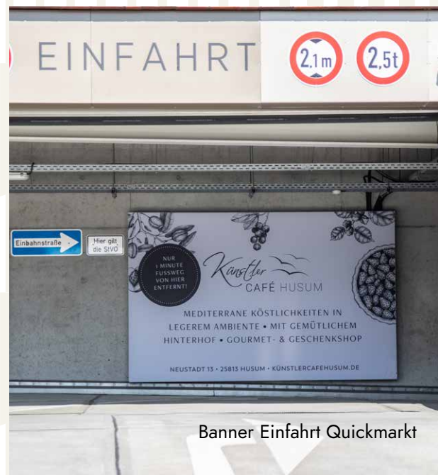
Banner Einfahrt Quickmarkt