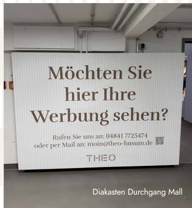
Diakasten Durchgang Mall

zzgl. Produktionskosten in Höhe von 250 €