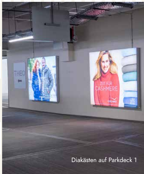
Diakästen auf Parkdeck 1